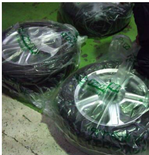
ありがとう。本当にありがとう。

あそびのお話ではありませんが、地元にくるま屋さんでのお話をひとつ。車移動の多い私は、この時期スタッドレスタイヤは欠かせません。年末年始の忙しい中、無理を承知で地元の自動車屋さんへ。予想通り忙しいとのこと、急には手配できないことをご説明いただきました。無理を申し上げるのも何ですので、本日これからの行き先と明日何うことを伝え、その場を後にしました。数分後、先程の自動車屋さんから『今どちらにいらつしやいますか？』と電話。所在地を告げると『戻ってきてください！』との事。理由を尋ねると、本日これからの行き先は既に雪が降っており、普通タイヤでの走行が危険